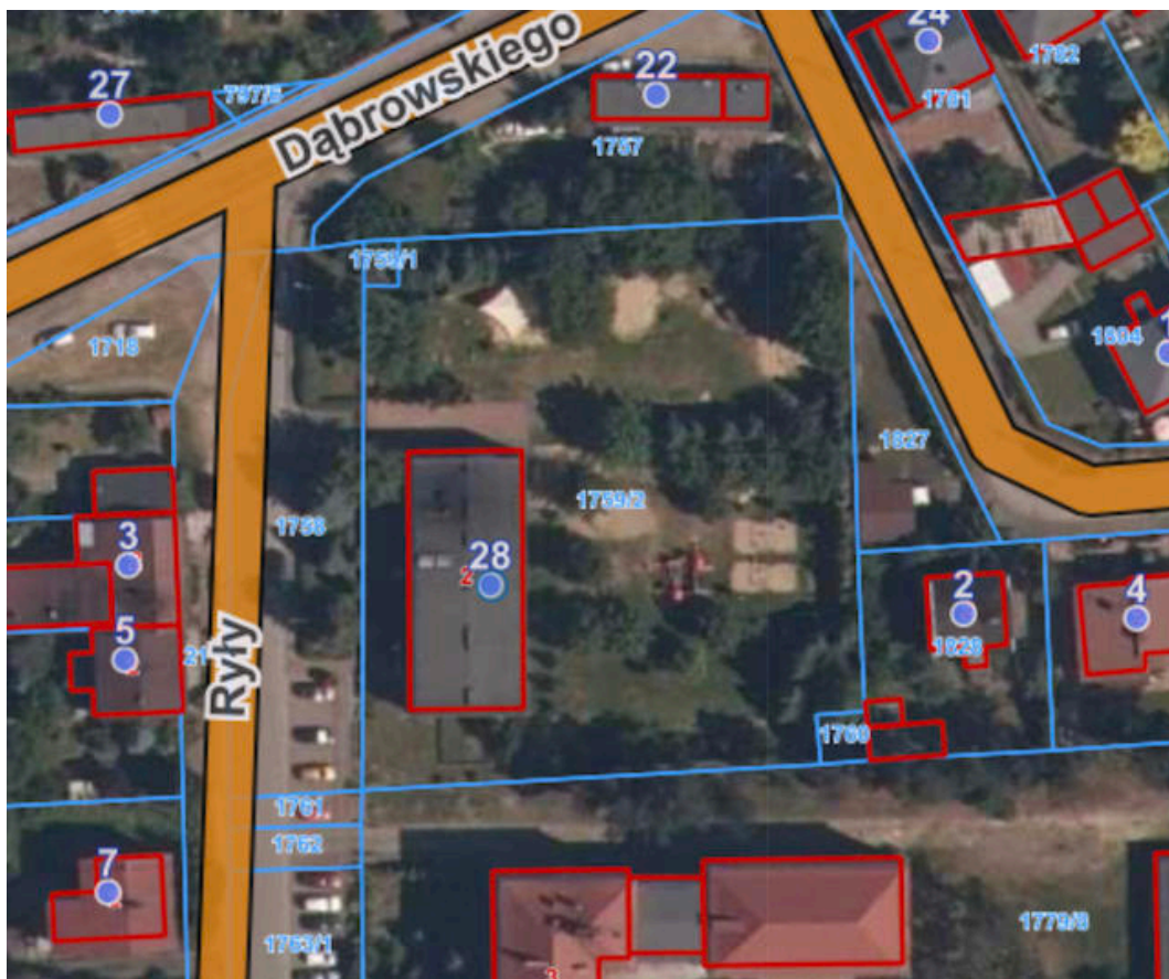
Lokalizacja miejsca planowanych prac