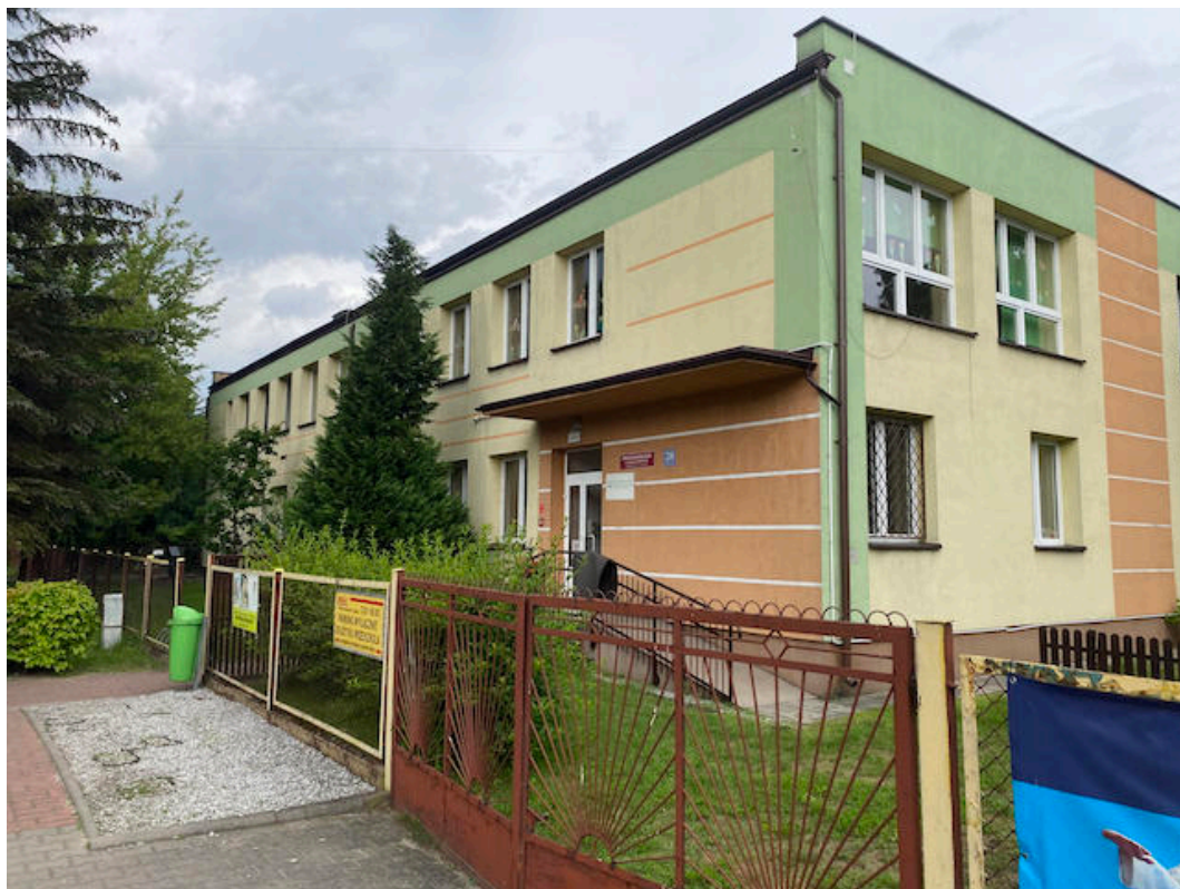
Fotografia z dnia kontroli 12.06.2024 rok